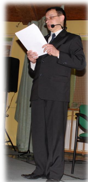
Pan dyrektor w roli prowadzącego