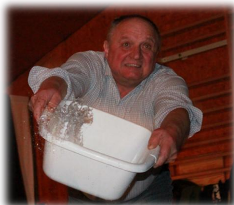
A ta miska wody? Czyżby atmosfera stała się zbyt gorąca?