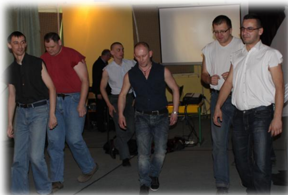
Tak wyglądałby wieczór paniński w wykonaniu naszych chłopaków