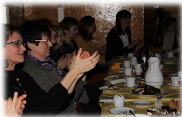
Miny pań mówiły same za siebie... trud naszych panów został doceniony gromkimi oklaskami.