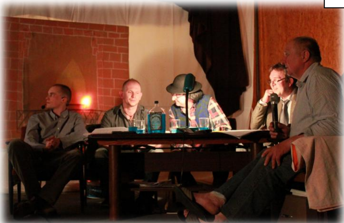
Męska rozmowa – i chłopiec staje się mężczyzną...

Tekst napisały :Dagmara Dyrda i Magdalena Klimek